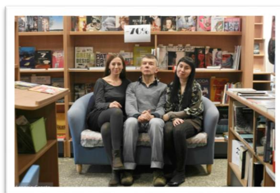
Fot. 4. Właściciele