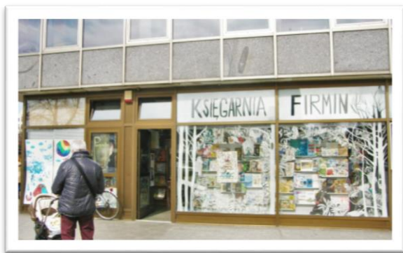
Fot. 1. Dawna lokalizacja księgarni

nowej lokalizacji w marcu. Pech chciał, że zbiegło się to w czasie z początkiem pandemii i pierwszej fali koronawirusa. Sytuacja wtedy była bardzo ciężka, ale o tym zaraz.