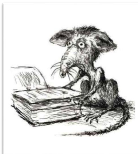
Fot. 7. Szczur Firmin z powieści