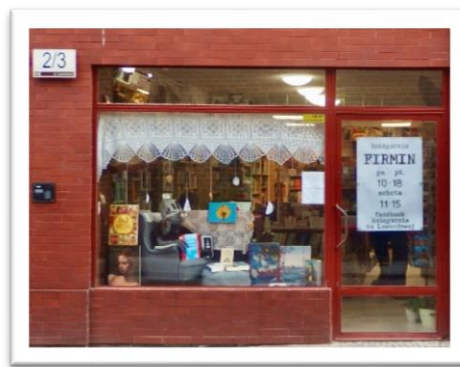
Fot. 2. Obecna lokalizacja księgarni