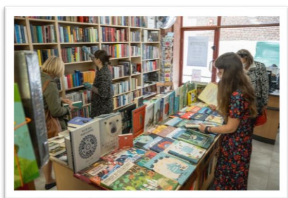
Fot. 3. Wnętrze księgarni

Podsumowując wszystkie wady i zalety obecnej lokalizacji, Pani Viola, Pani Ola i Pan Marcin nie żałują swojej decyzji. Lokal przy ulicy Lawendowej 2/3 okazał się bardzo dobrym miejscem i cała trójka czuje się tu jak w domu.